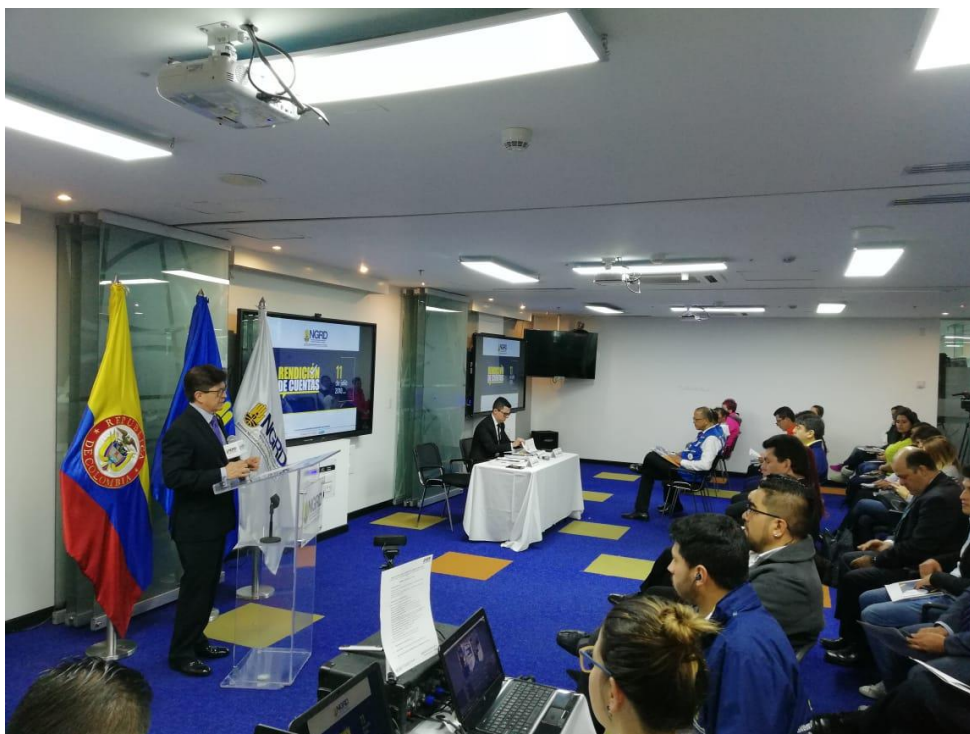
Apertura – Audiencia rendición de Cuentas 2018