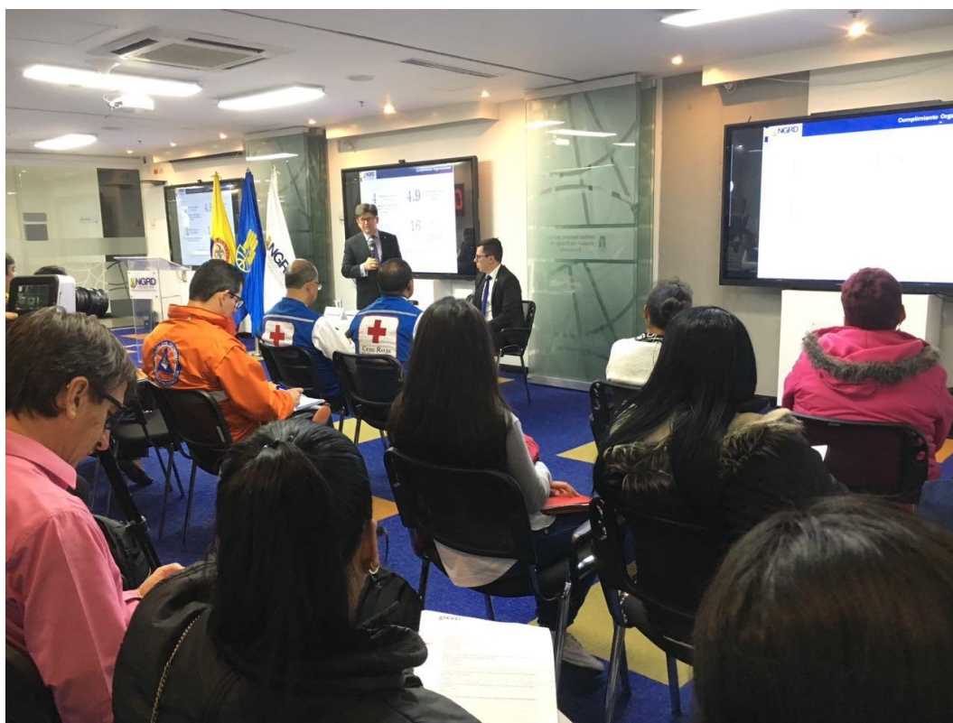
Asistentes – Audiencia rendición de Cuentas 2018