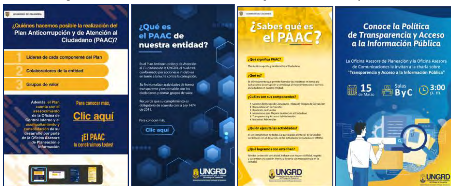
Imagen nro. 4: Evidencia de divulgación interna y externa: