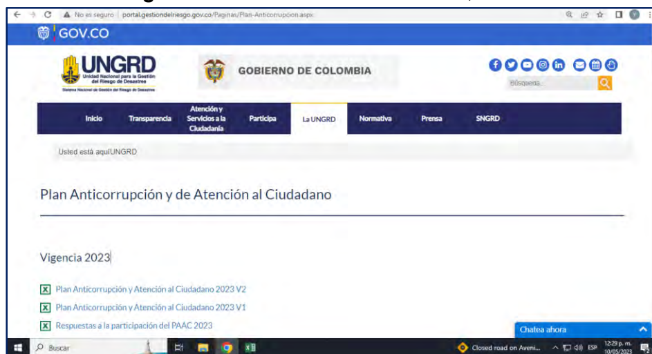
Imagen nro. 1: Publicación PAAC 2023, versión 2