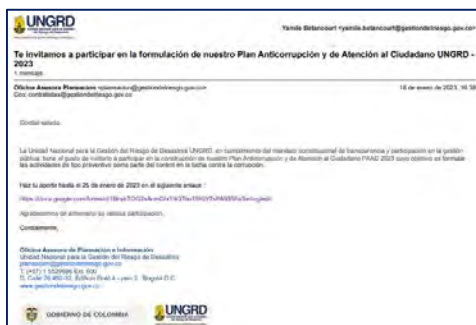
Imagen nro. 3: Evidencia de la invitación a Colaboradores de la Entidad:

De la consulta realizada a interna, se observó la participación de (2) personas, no se observaron aportes.