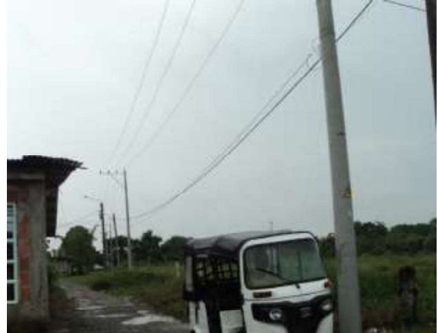
Red media tensión y transformador