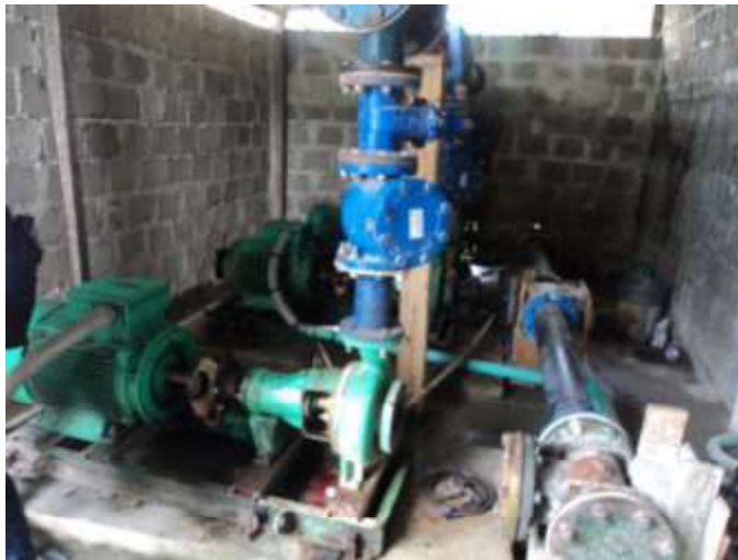
Pilotes hincados y traslado bombas a caseta provisional