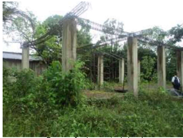
Pozo profundo, caseta de bombeo,