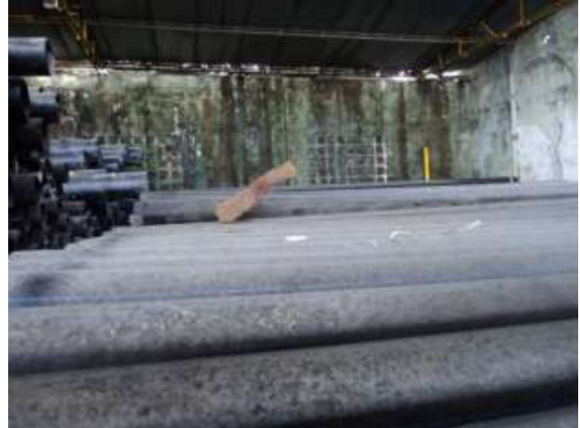
Tubería no instalada, pagada como suministro almacenado en bodega

El pago al contratista de la tubería en polietileno sin estar instalada, no es consecuente con el alcance del contrato consistente en la ejecución de las obras para la optimización y ampliación del sistema de acueducto de la cabecera municipal de Guapi en su Etapa I, entre ellas la construcción de las redes de distribución de los sectores 1 y 2. La tubería pagada como suministro se encuentra actualmente en una bodega inadecuadamente almacenada, con alto riesgo de sufrir deterioro y daños, además, sin tener certeza de que se concrete su efectiva instalación, dada la finalización del contrato de obra.