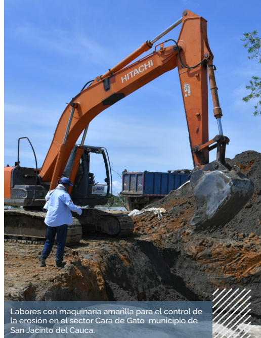
Labores con maquinaria amarilla para el control de la erosión en el sector Cara de Gato municipio de San Jacinto del Cauca.

Instalación de 6.505 megabolsas de 14m 3 para el cierre del jarillón. A la fecha se lleva el 25,6% de la obra con la instalación de 1.603 megabolsas en ambas puntas.