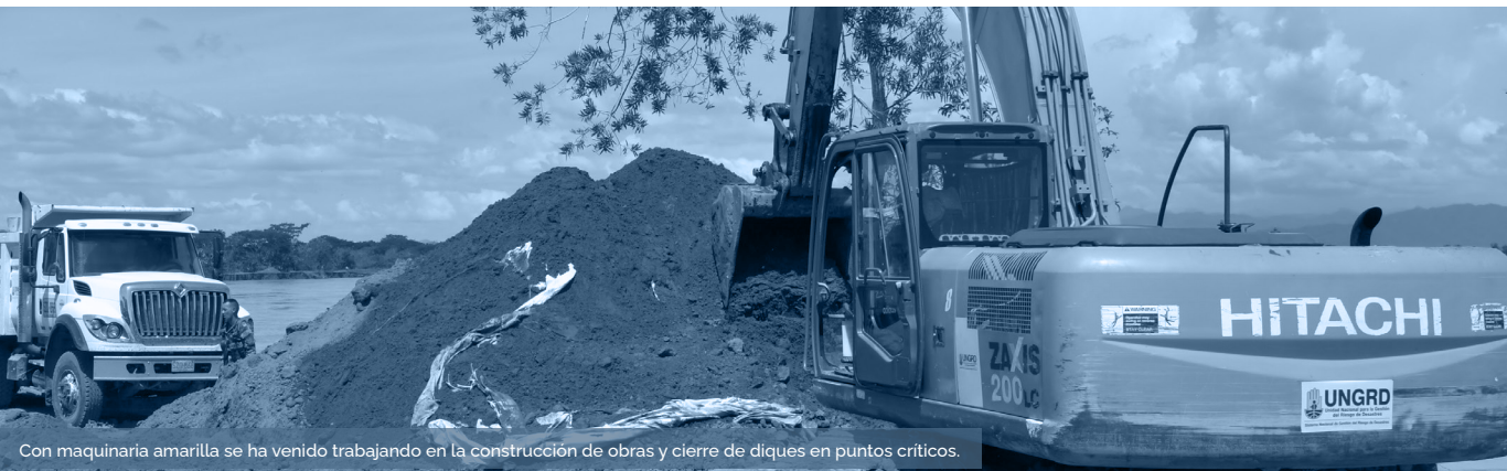
Con maquinaria amarilla se ha venido trabajando en la construcción de obras y cierre de diques en puntos críticos.