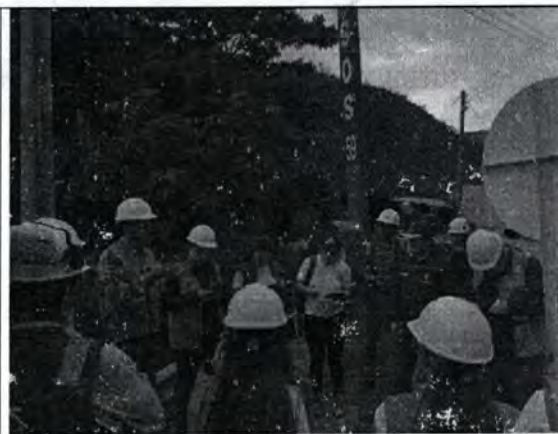
Imagen propia 2. Contextualización de problemática del Puente Aserrío PR64+400

Se contextualiza por parte de personal de Concesionaria Vial Andina la problemática actual que presenta el puente en su cimentación del estribo aguas arriba margen derecha.