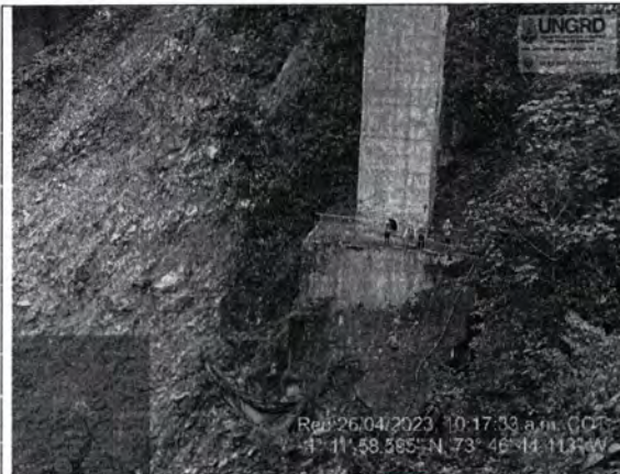
Imagen propia 3. Se evidencia pérdida de soporte

Continuación de la Resolución "Por medio de la cual se realizan los reconocimientos económicos que deban efectuarse a favor de los contratistas, concesionarios y/o agentes privados por la disposición de la maquinaria, elementos, equipos, personal y/o la ejecución de las obras, en el marco de la atención inmediata a las emergencias viales o eventos que se presentan en zona de actividad o influencia y que son priorizados en virtud del convenio No. 9677-CV020-049-2023"