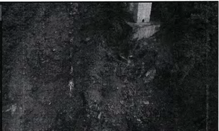
Imagen ANI 4. Se evidencia pérdida de soporte vista aguas abajo margen izquierda