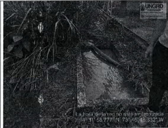
Imagen propia 4. Trampa de grasas del Lavadero aledaño al Puente