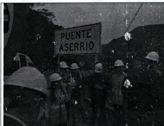
Imagen propia 1. Personal de la visita técnica al Puente Aserrío PR64+400

Se inicia con la visita técnica al puente del PR 64+400 con nombre PUENTE ASERRIO de la Vía Bogotá – Villavicencio, municipio de Guayabetal, con funcionarios de la ANI, CORPORINOQUIA, Alcaldía Municipal de Guayabetal, Bomberos Municipal de Guayabetal, Concesionaria Vial Andina, Interventoría CMA