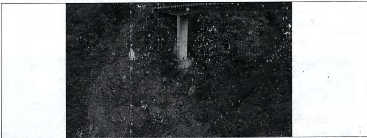
Imagen propia 9. Apoyo de aguas arriba margen derecha (margen Bogotá) del puente

Se evidencia las afectaciones por la pérdida de estabilidad del apoyo de aguas arriba margen derecha (margen Bogotá) del puente, si este proceso erosivo continua sin control generaría el colapso de la estructura de apoyo al puente.