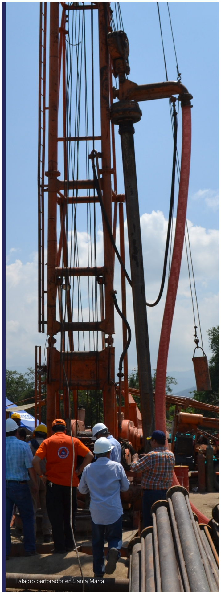
Taladro perforador en Santa Marta