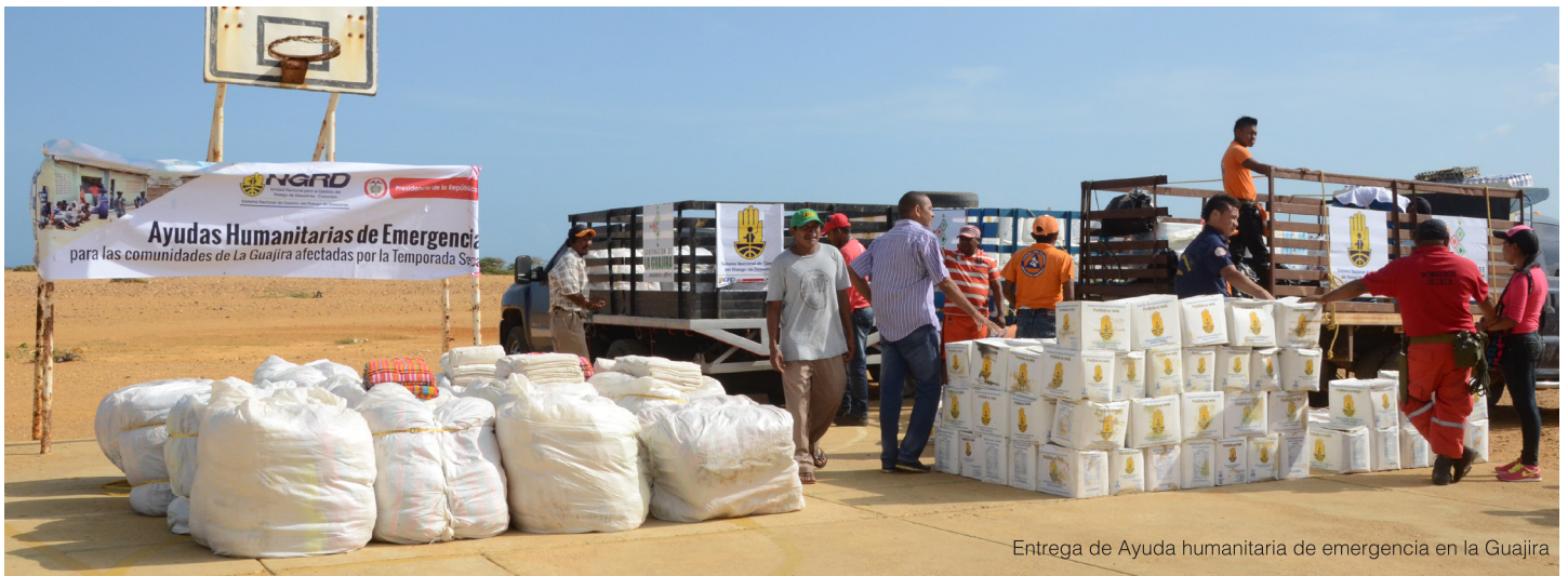
Entrega de Ayuda humanitaria de emergencia en la Guajira