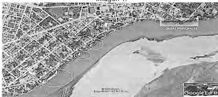
Imagen 1 – Localización obras de protección para permiso de Ocupación de Cauce Fuente: Corporinoquia.

Precisa la Autoridad que "(...) Dentro del formulario de costos allegado en la solicitud del municipio de Orocué, no se anexa presupuesto detallado de las obras y/o actividades proyectadas, no se determinan costos para la Interventoría de la construcción de las obras y no se determinan costos para la implementación del Plan o Medidas de Manejo Ambiental, factores determinantes para continuar con el procedimiento de evaluación y estudio de la solicitud de los permisos ambientales. (...)"