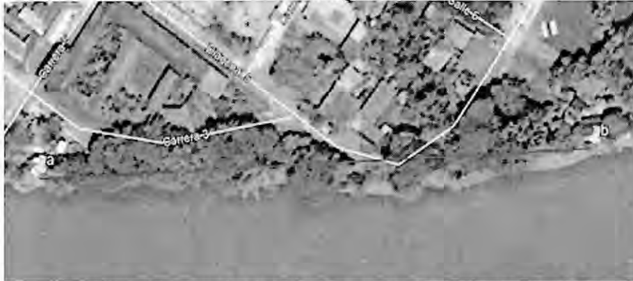
Imagen No. 2 – Sitio de las obras de protección proyectadas, posible Aprovechamiento Forestal

De lo anterior se concluye que la entidad ejecutora y la interventoría del contrato en comento, no han obrado con oportunidad para garantizar el cumplimiento de los requisitos ambientales en relación con la obtención de los permisos necesarios para la realización de la obra objeto del contrato.