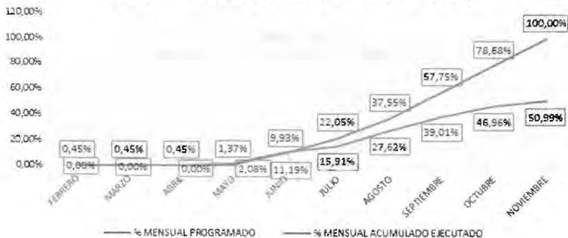
Gráfico No. 1. % programado vs % ejecutado (Feb 2020 – Nov 2020)

Fuente: Informes de interventoría UNGRD Elaborado por: URI – DIARI